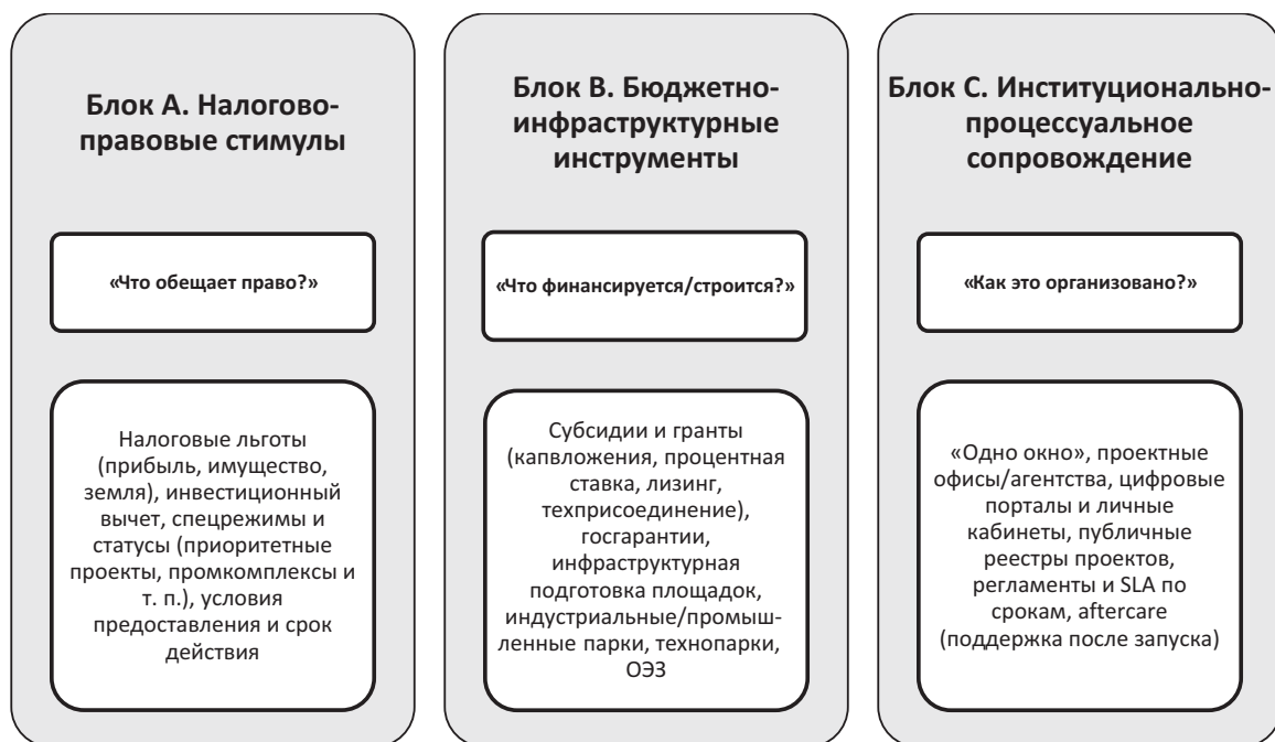
Рис. 1. Таксономия региональных мер поддержки инвестпроектов: три блока

В данном исследовании будут сформированы три блока таксономии, каждый из которых отвечает на свой исследовательский вопрос (рис. 1).