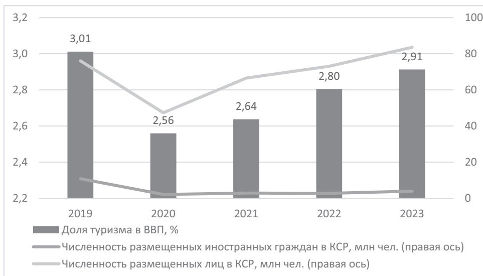
Рис. 3. Ключевые показатели турпотока (млн поездок), 2019–2023 гг.

Ввиду того, что среди целей развития туристического сегмента в России указывается также увеличение доли туризма в ВВП до 5% к 2030 г. 2 , необходимо стимулировать не только рост туристического потока в целом, но и увеличение иностранного туризма, так как «средний чек» иностранного туриста, как правило, выше «среднего чека» отечественного туриста 3 .